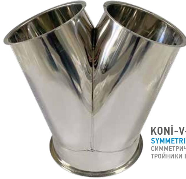
KONİ-V-ÇATAL SYMMETRICAL CONICAL FORKS СИММЕТРИЧНЫЕ ТРОЙНИКИ КОНУСНЫЕ